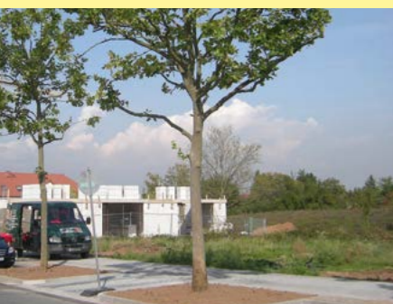
Raunheim: Ludwig-Buxbaum-Allee gleiche Stelle nachher