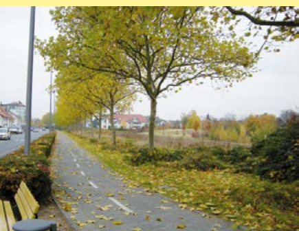
Raunheim: Ludwig-Buxbaum-Allee vor der Verpflanzung

Auch in diesem Jahr wurden von MB Baumdienste wieder umfangreiche Großbaumverpflanzungen durchgeführt. So wurden z. B. im Stadtgebiet von Raunheim 22 junge Platanen an der Ludwig-Buxbaum-Allee verpflanzt und wie hier auch im untersten Foto zu sehen, einige junge Bäume auf dem Messegelände in Frankfurt.