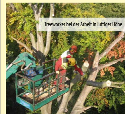
Treeworker bei der Arbeit in luftiger Höhe

Bei MB Baumdienste wird Weiterbildung groß geschrieben. 4 weitere Mitarbeiter haben ihre Prüfung zum „European-Treeworker“ vor der Kommission der Landwirtschaftskammer in Münster mit Erfolg bestanden. Wir gratulieren hierzu ganz herzlich!