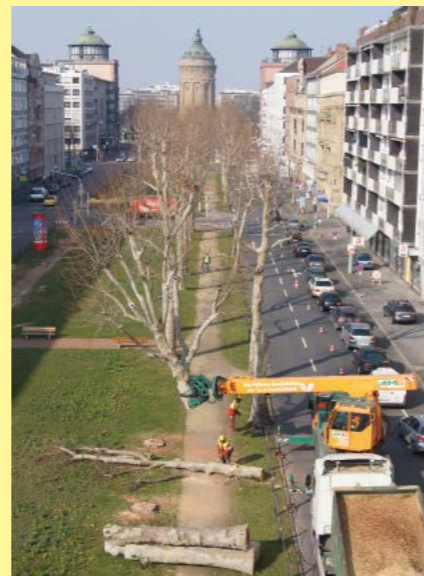
Fällung Augustaanlage

Mit den Baumfällarbeiten im ersten Bauabschnitt wurde MB Baumdienste beauftragt. Rund 100 Bäume standen in diesem ersten Bauabschnitt. Bei günstiger Witterung konnten die Fällarbeiten zügig durchgeführt- und somit die Verkehrsbehinderung so gering wie möglich gehalten werden.