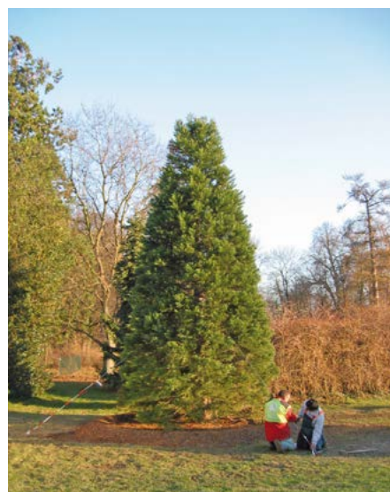
Großbaumverpflanzung mit EUOTREE 3000

Das von 1700 bis 1745 erbaute Schloss Biebrich mit seiner stark frequentierten Parkanlage gehört zu den Highlights der Wiesbadener Bevölkerung. Um den Landschaftsgarten als Kulturdenkmal in bestem Zustand zu erhalten, wurde im Jahr 2012 MB Baumdienste nach gewonnener Ausschreibung (wie auch in den vergangenen Jahren) mit der Baumpflege beauftragt. Neben den klassischen, umfangreichen Baumpflegearbeiten mussten aber auch einige Baumfällungen von nicht mehr stand- und bruchfesten Bäumen vorgenommen werden. Der Schlosspark ist öffentlich zugänglich. Daher ist die Besucherfrequenz, abseits von Großveranstaltungen wie z. B. dem bekannten Pfingst-Reitturnier ( www.pfingstturnier.org ), sehr groß. Aus diesem Grund ist es zwingend nötig, den Baumbestand in allen Bereichen der denkmalgeschützten Parkanlage verkehrssicher zu gestalten.